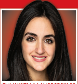
EMMANUELLA LAMBROPOULOS DÉPUTÉE / MP Saint-Laurent Emmanuella.Lambropoulos@parl.gc.ca (514) 335-6655