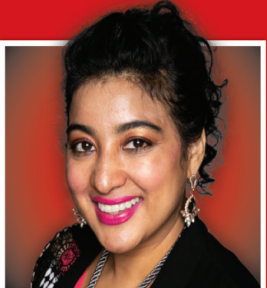
ANJU DHILLON DÉPUTÉE / MP Dorval – Lachine – LaSalle Anju.Dhillon@parl.gc.ca (514) 639-4497

YOUR FEDERAL LIBERAL MPs WISH TO HIGHLIGHT THIS IMPORTANT DATE