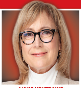
ANNIE KOUTRAKIS DÉPUTÉE / MP Vimy Annie.Koutrakis@parl.gc.ca (450) 973-5660