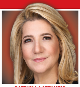
PATRICIA LATTANZIO DÉPUTÉE / MP Saint-Léonard – Saint-Michel Patricia.Lattanzio@parl.gc.ca (514) 256-4548