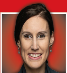
MARIE-GABRIELLE MENARD DÉPUTÉE / MP Hochelaga – Rosemont-Est Marie-Gabrielle.Menard@parl.gc.ca (514) 201-8608