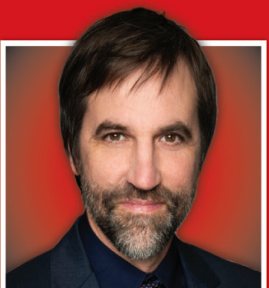
HON. STEVEN GUILBEAULT DÉPUTÉ / MP Laurier – Sainte-Marie Steven.Guilbeault@parl.gc.ca (514) 522-1339