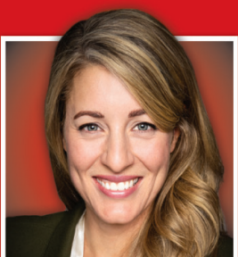
HON. MÉLANIE JOLY DÉPUTÉE / MP Ahuntsic-Cartierville Melanie.Joly@parl.gc.ca (514) 383-3709