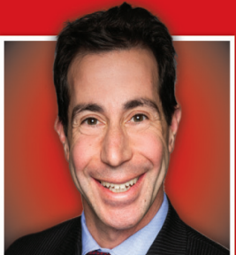
ANTHONY HOUSEFATHER DÉPUTÉ / MP Mont-Royal / Mount Royal Anthony.Housefather@parl.gc.ca (514) 283-0171